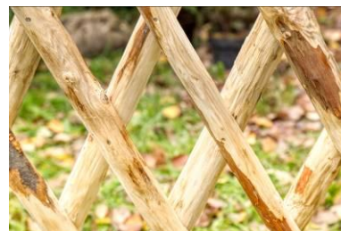
Vide de 12 cm

CLOTURES – TUTEURS – TREILLAGES DECORATIFS – RONDINS